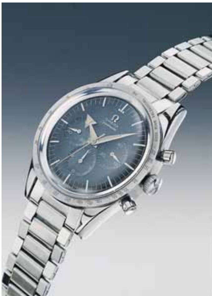
Die Omega Speedmaster von 1957, 12 Jahre später wird sie die erste Uhr sein, die ein Mensch auf dem Mond trägt.

Auch die elektrische Borduhr fiel aus, die Astronauten mussten sich auf ihre Speedmaster verlassen, um die Triebwerke 14 Sekunden auszuschalten und anschliessend neu zu zünden um auf die richtige Flugbahn für die